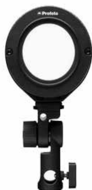
Clic OCF Adapter II