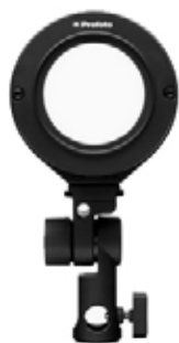
Clic OCF Adapter II